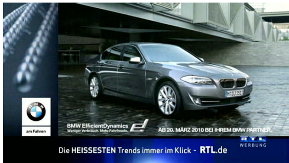
TV - Exclusive Position - individueller Pre-Split

Im individuellen Pre-Split bei RTL wurde das Key Visual mit den schwingenden Metallkugeln aus dem Spot auch im Rahmen des Splitscreens integriert. Beim Logomorphing bei VOX wurde an die Stelle der strahlendroten VOX Kugel die Metallkugel als Key Visual platziert: So gelang die perfekte Symbiose zwischen BMW-Branding und starker Sendermarke. Beim Newscountdown war das BMW-Branding Teil des Rahmens und sorgte hier für zusätzliche Markenpräsenz. Im Movesplit wurde das n-tv Senderlogo zunächst von den schwebenden Metallkugeln überlagert und "moved" dann in einem fließenden Bildwechsel in den klassischen Spot über.